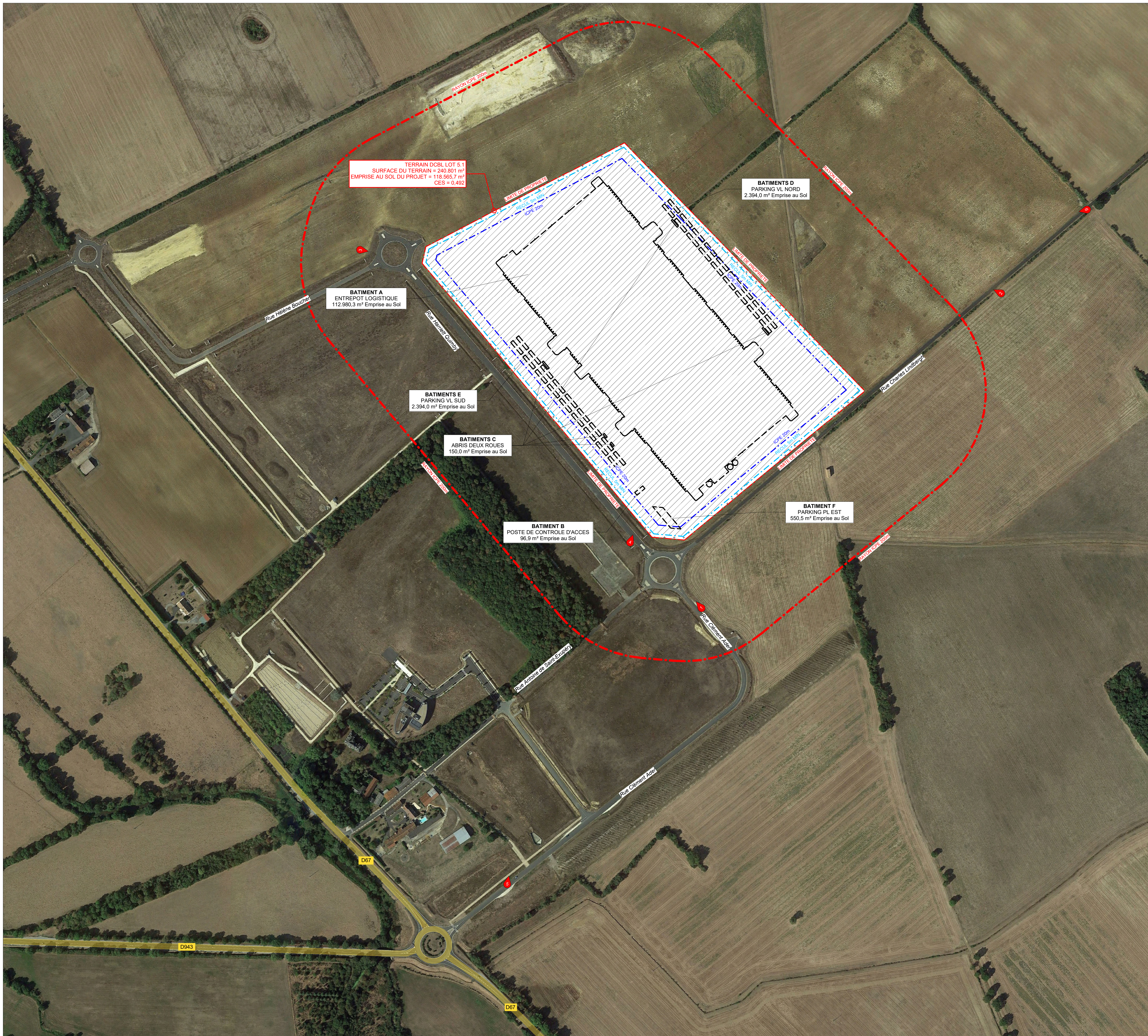
PLAN DU TERRAIN - 1 / 2,500ème