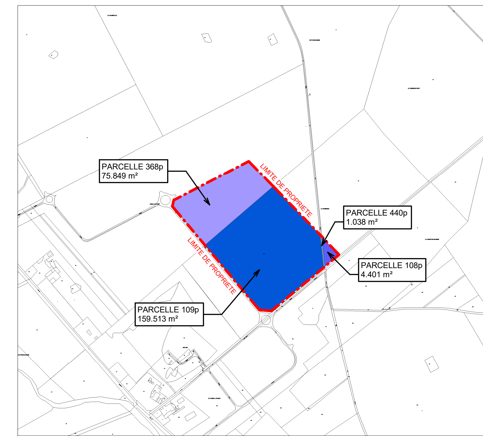
PLAN CADASTRAL - 1 / 10,000ème